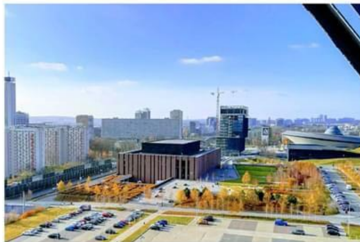
Siedziba Narodowej Orkiestry Symfonicznej Polskiego Radia