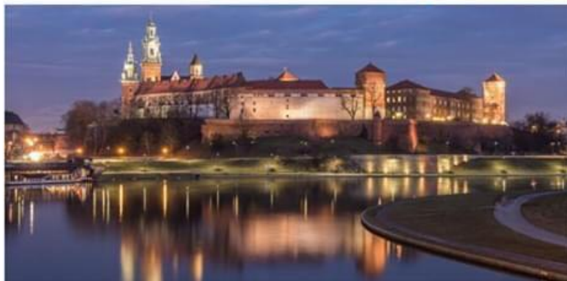
Zamek Królewski na Wawelu