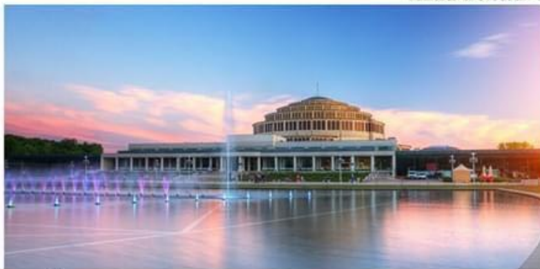
Hala Stulecia / Wrocławskie Centrum Kongresowe