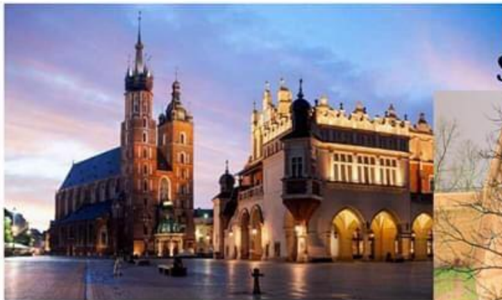
Bazylika Mariacka i Sukiennice