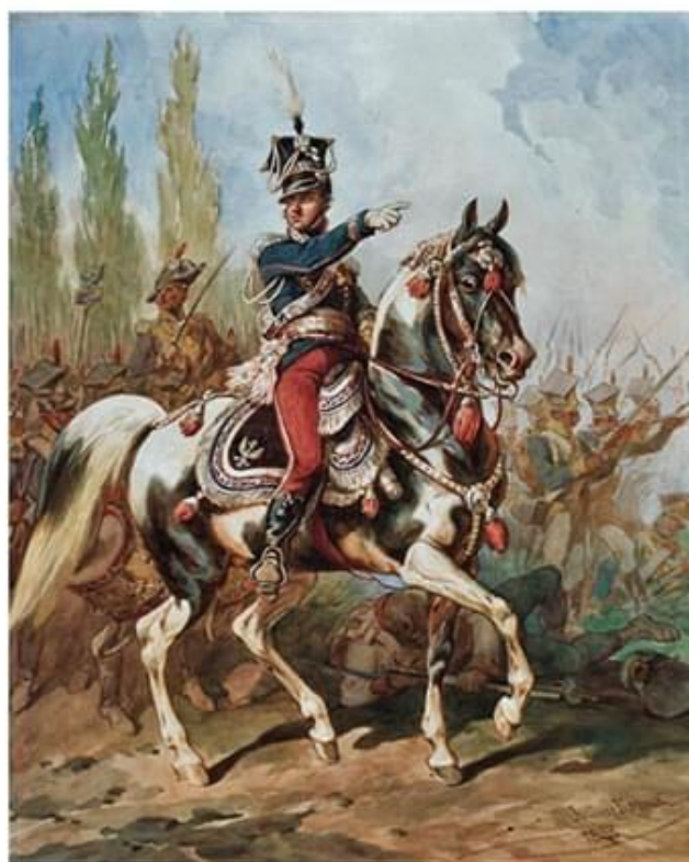
Gen. Jan Henryk Dąbrowski na czele Legionów

Hymnem Rzeczypospolitej Polski jest "Mazurek Dąbrowskiego". W 1797 roku poeta Józef Wybicki napisał "Pieśń Legionów Polskich we Włoszech", którą na cześć generała Dąbrowskiego nazwano "Mazurkiem Dąbrowskiego". Początkowo hymn składał się z 6 zwrotek. 26 lutego 1927 roku Ministerstwo Spraw Wewnętrznych ogłosiło, że jest to hymn Polski.